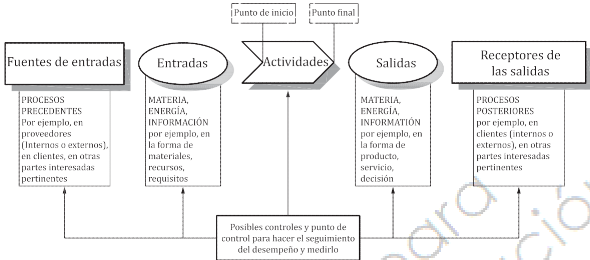
Figura 1 — Representación esquemática de los elementos de un proceso